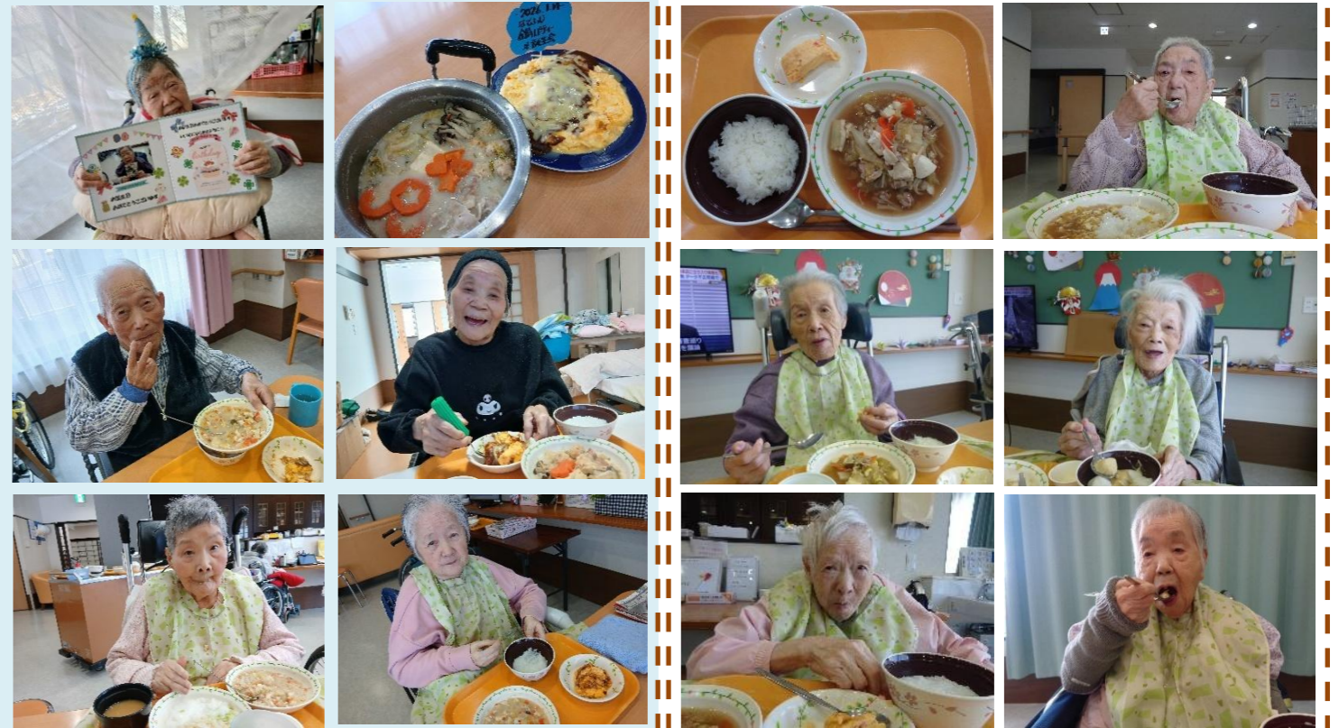
ごはん、ごま豆乳鍋、野菜オムレツ