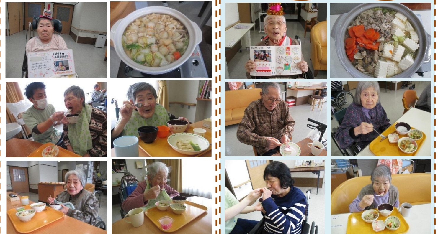
ごはん、寄せ鍋、ポテトサラダ、フルーツゼリー