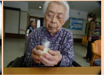
ひな壇の前で写真を撮りました。素敵な表情です♡