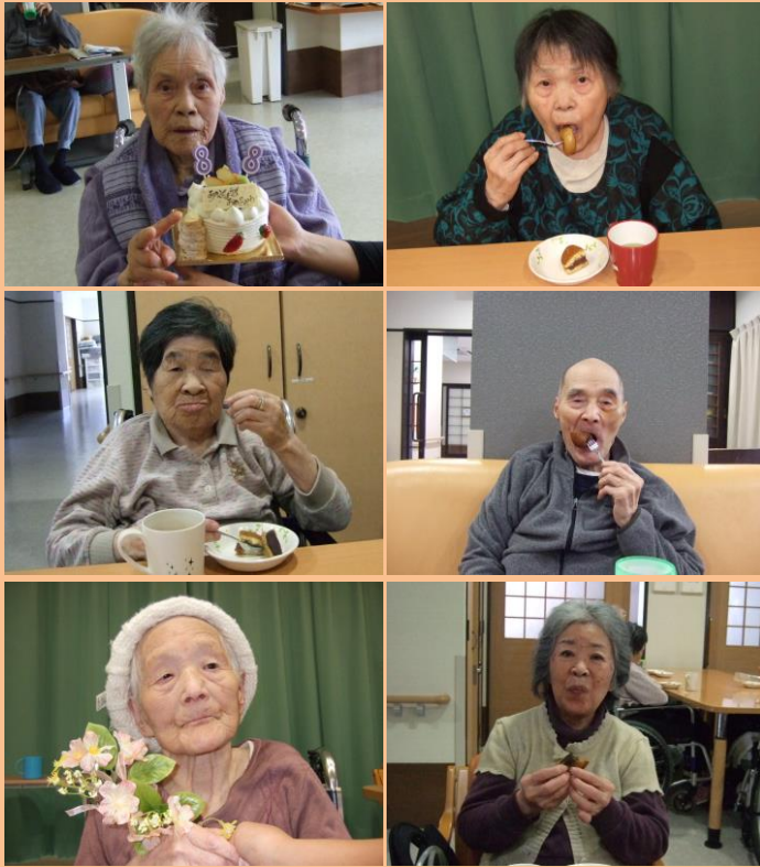
まんじゅう・どら焼き・ケーキ・プリン・せんべい