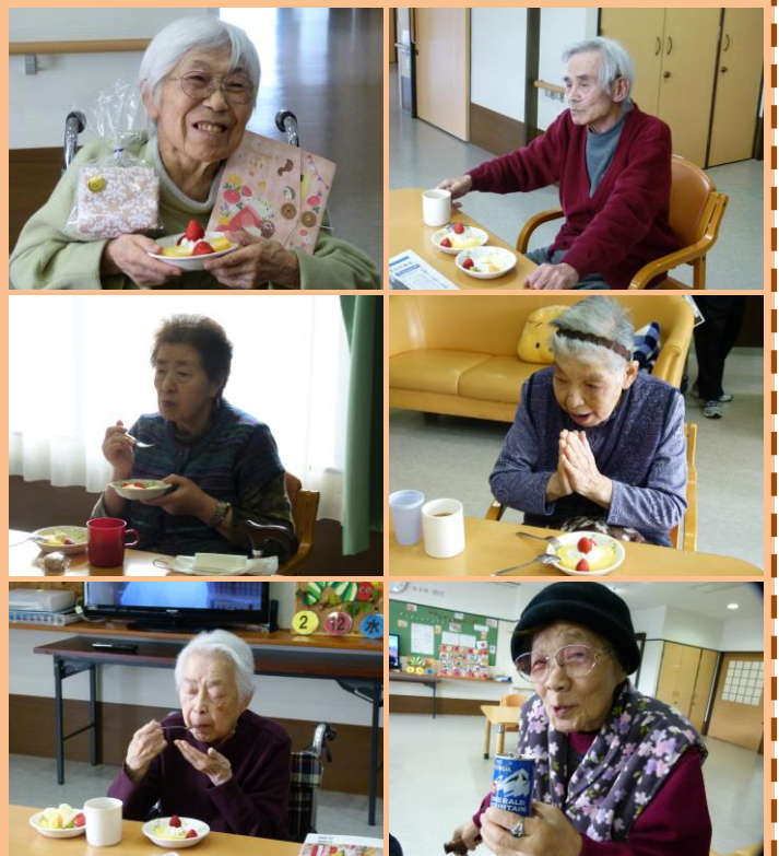
ロールケーキ・せんべい・チョコレート