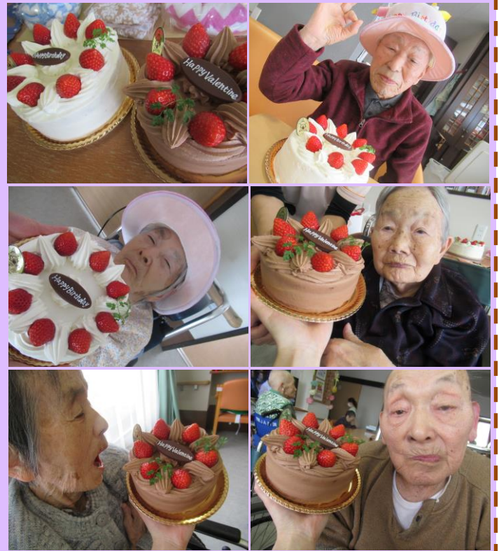
ショートケーキ・チョコケーキ