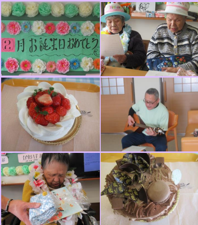
ショートケーキ・チョコケーキ