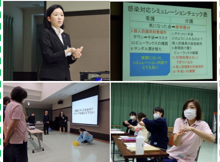
感染対応シミュレーションチェック表