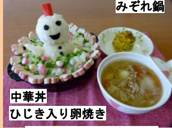
中華井 ひじき入り卵焼き