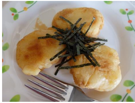
ポテト餅のバター焼き