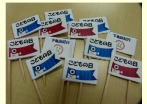
↑お子様ランチの旗は手作りです♪