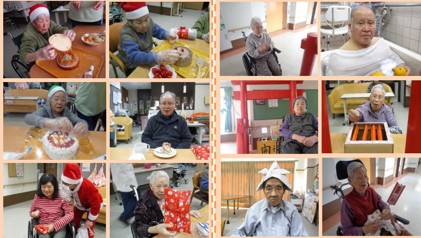
12月25日(水) クリスマスケーキ作り