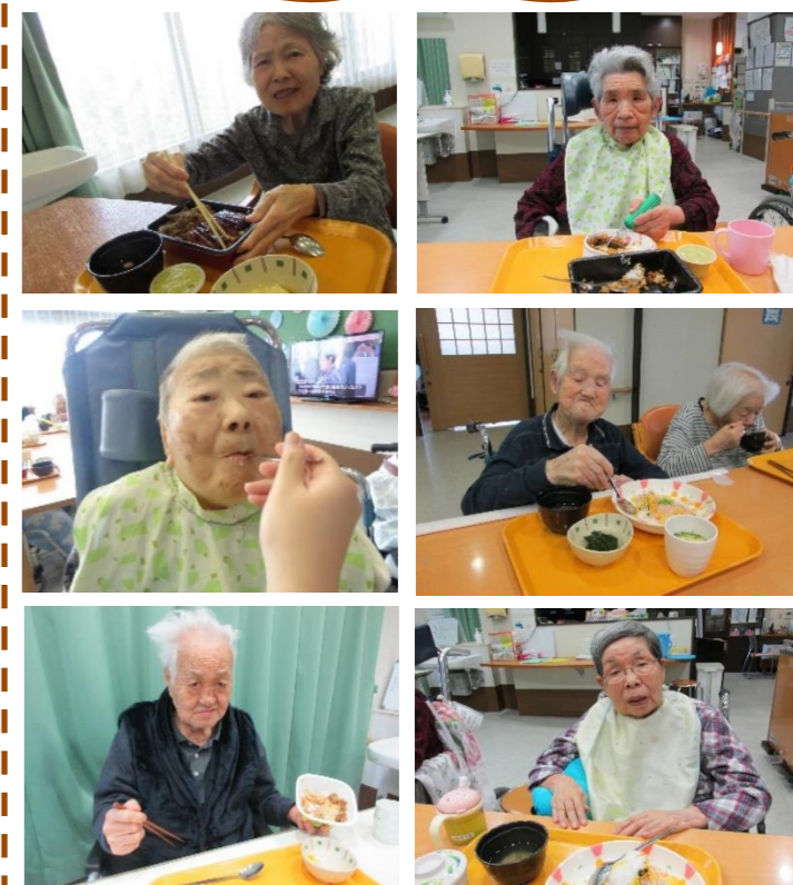
<吉野家>うな丼・牛丼