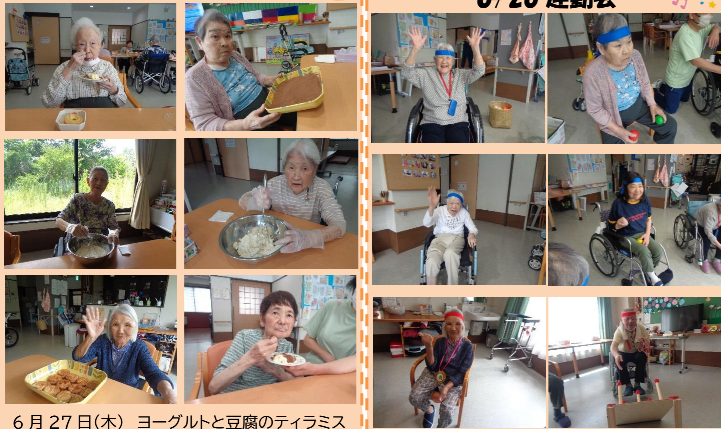
6月27日(木) ヨーグルトと豆腐のティラミス