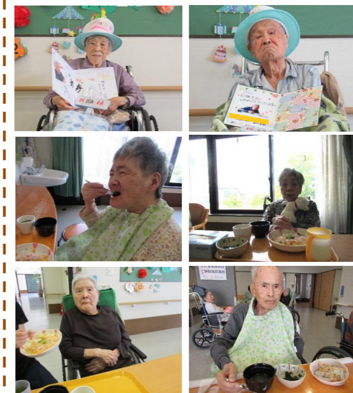
<吉野家>うな皿・まぐろのたたき