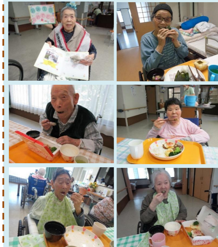
<びっくりドンキー>エッグハンバーグ