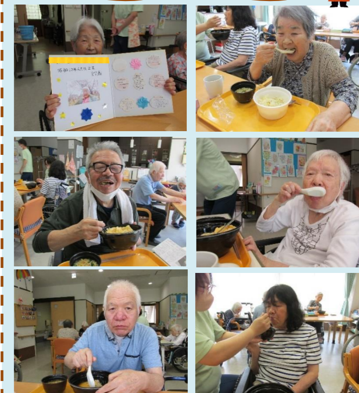
<大阪王将>天津飯・天津炒飯