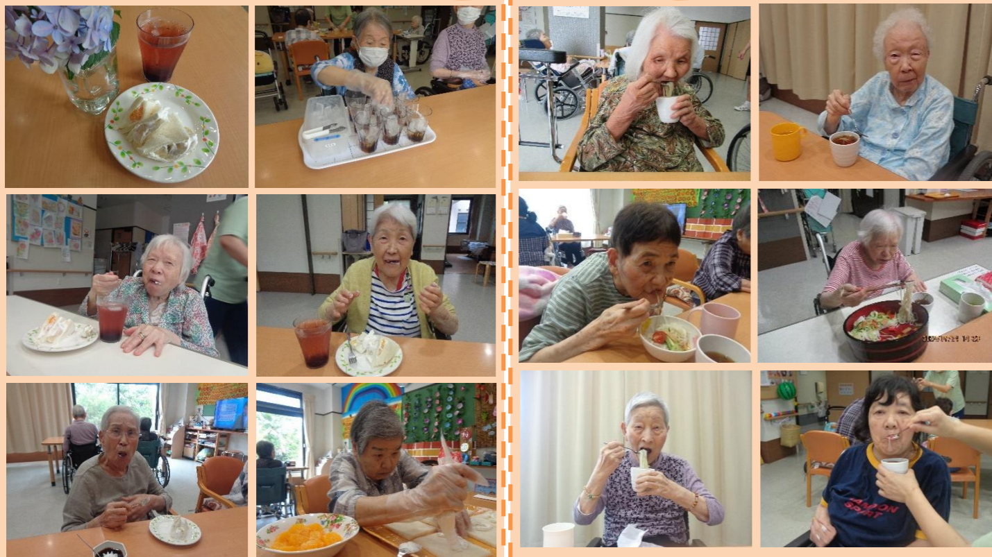
7月26日(金) フルーツサンド、リンゴ酢ドリンク