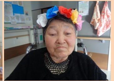
4月24日(月) フルーツたっぷり♡ケーキ作り