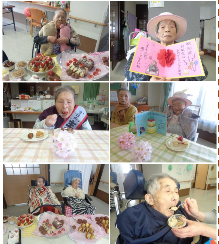
ケーキ、プリン、饅頭、どら焼き