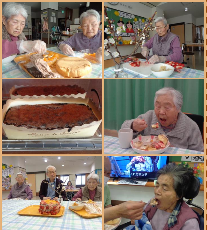
ケーキ、干し芋、芋チップ、せんべい