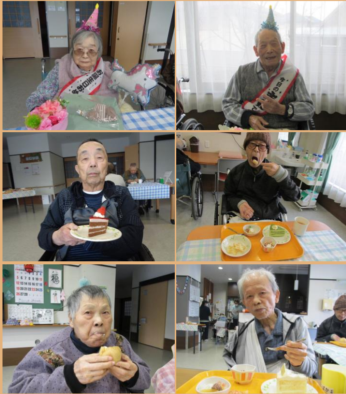
ケーキ、プリン、シュークリーム、コンポート、せんべい