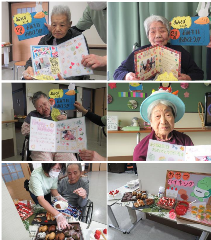
ケーキ、ワッフル、饅頭、桜餅、どら焼き、ヨーグルト