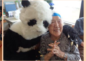
6月23日(金) わらび餅作り