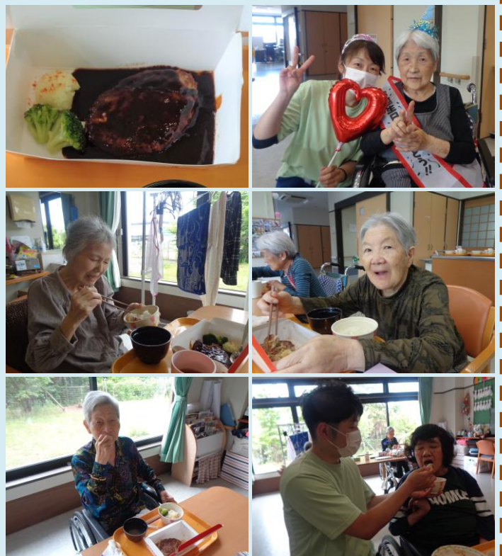
びっくりドンキー・ハンバーグ