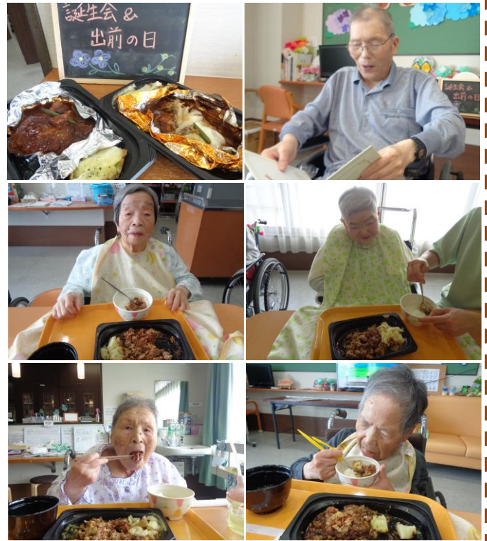
ココス・ハンバーグ