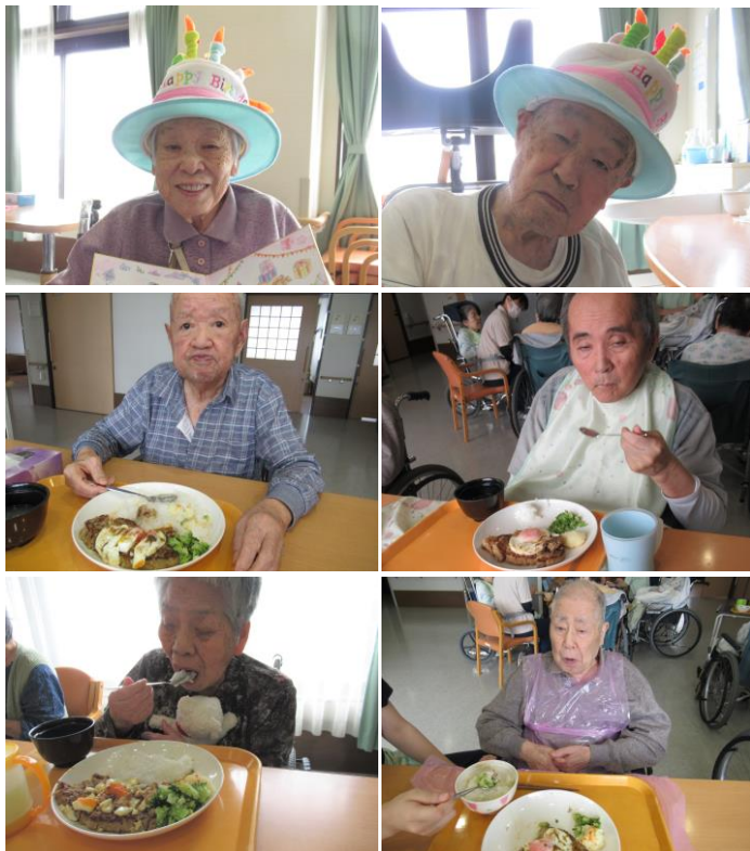
びっくりドンキー・ハンバーグ