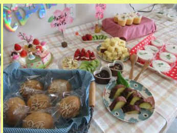
おやつバイキング