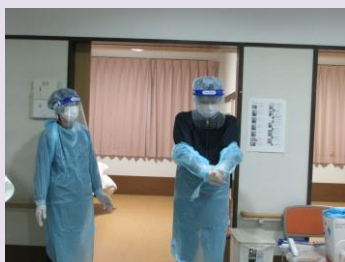
感染症発生時のシミュレーション

月1回おやつ作りを行い、入居者様に提供しています。皆さん楽しく作り、美味しく食べていただいています。