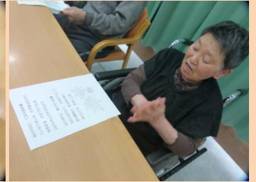
10月20日(水) ハンバーガー作り